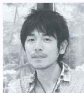
展示とコンサートへの抱負を語るaCaeさん

評価されています。しかし、日本人は自分以外の価値基準で物を見てしまいがちで、本来自分たちがもっている特性に気付いてないのではと感じます。