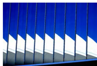
横浜／みなとみらい21

平成20年10月28日（火）～11月7日（金） 9：30～18：15 場所：文部科学省情報ひろば「ラウンジ」