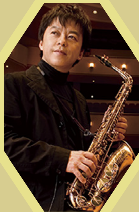
〈ソプラノ・サクソフオーン〉 須川展也