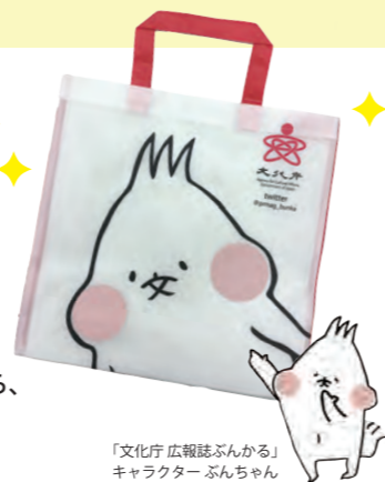
「文化庁 広報誌ぶんかる」キャラクター ぶんちゃん

霞が関音楽祭5周年の今年はちょっとクベツ♪ 3種類のスタンプを全て集めた方には、「文化庁 広報誌ぶんかる」キャラクター ぶんちゃんのオリジナルバッグを差し上げます！各スタンプの設置場所は中面のイベント情報を御覧ください。3種類のスタンプが集まったら、その場でバッグをお渡しします。 ※バッグはなくなり次第終了です。※お一人様1回の御参加につき1枚のお渡しとなります。