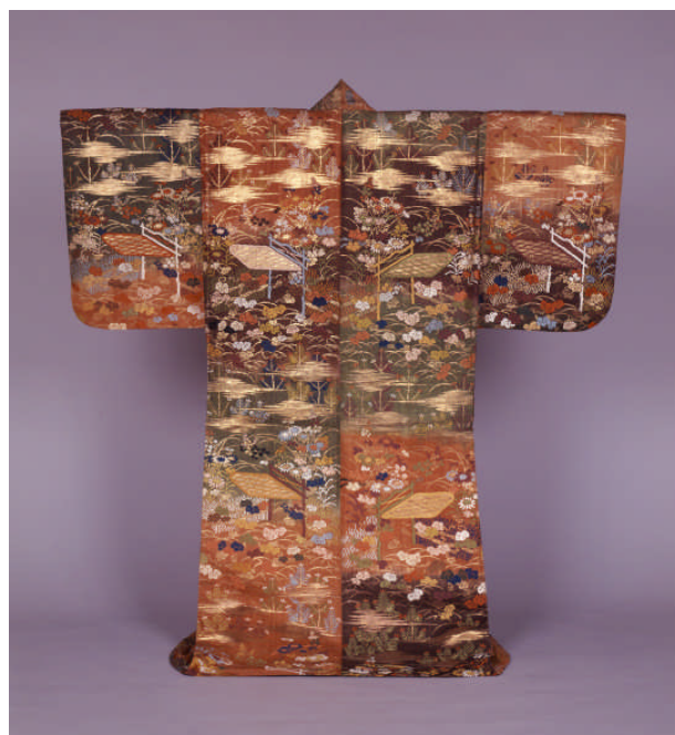
べにくろもえぎだんあきくさしおり どもんようからおり 紅黒萌黄段秋草枝折戸文様唐織