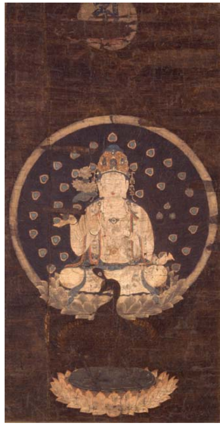
重要文化財 絹本着色孔雀明王像