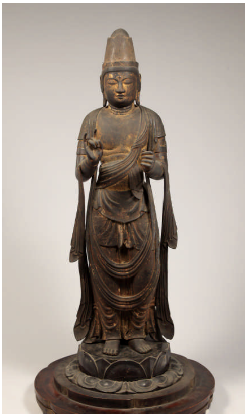
重要文化財 木造聖観音立像