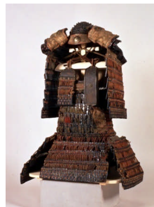
国宝 赤韋威鎧 かぶと おおそでつき 兜、大袖付