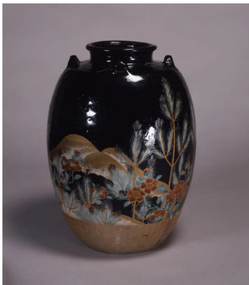
重要文化財 いろえわかまつずちやつほ 色絵若松図茶壺 にんせいさく 仁清作