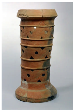
重要文化財 特殊器台

収蔵資料は考古・美術・古文書・民俗・刀剣・備前焼などの分野で1万5千件を有し、「岡山県の歴史と文化」をテーマに展示を構成しています。また、特別展、企画展や、他県の博物館との連携による交流展も継続的に開催しています。