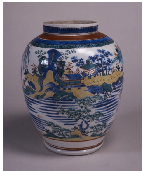
いろえさんすいもんつほ 色絵山水文壺