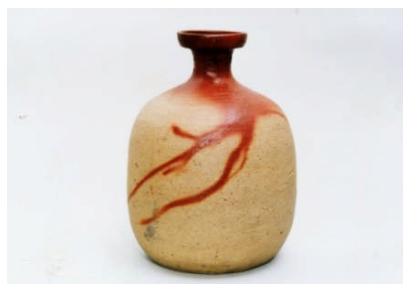
備前焼 緋襷大徳利