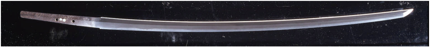
国宝 たち 太刀 めいまさつね 銘正恒