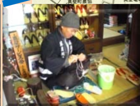
(イ) 真壁地区の商家と商い