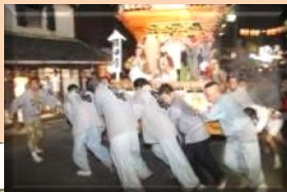
(ア) 真壁の町並みと祇園祭

祭礼は山尾地区の五所駒瀧神社から城下町の真壁地区に神輿の遷座を受け、各町の安全と五穀豊穡を祈願するもので、夜には各町から山車が繰り出され、賑やかに町を彩る。