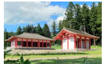
【慧日寺跡に復元された金堂・中門】

国史跡「慧日寺跡」等を含み、慧日寺の継承・復元活動や磐梯山を中核とする山岳信仰、赤枝彼岸獅子舞等が受け継がれ、門前町や宿場町の歴史的建造物が残る大寺・本寺地区を重点区域とし、史跡慧日寺跡の整備・活用や歴史的まちなみの整備、伝統文化財継承事業等が位置づけられています。