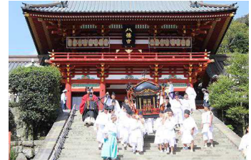
【鶴岡八幡宮の例大祭】

国宝「円覚寺舍利殿」等を含み、鶴岡八幡宮における例大祭や御霊神社の面掛行列、山稜の保全活動等が受け継がれ、社寺や港跡、切通等の歴史的建造物が残る古都鎌倉区域を重点区域とし、歴史的風致形成建造物の保存整備や(仮称)鎌倉歴史文化交流センターの整備、風致保存会助成事業等が位置づけられています。