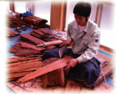
檜皮こしらえ作業