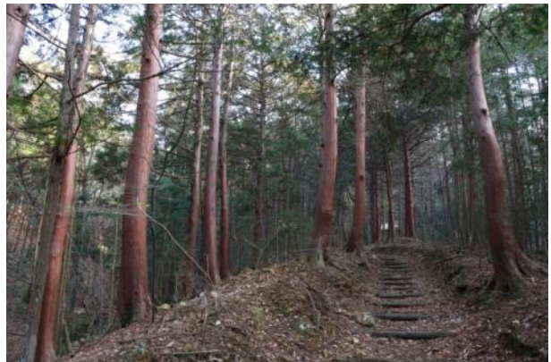
4. 浅間神社摂社山宮神社境内林