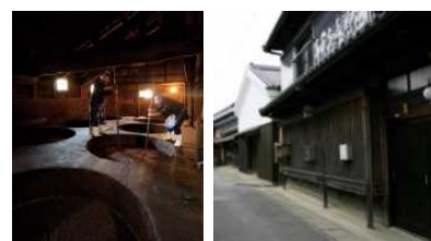
【醤油醸造と歴史的建造物】

国選定「湯浅町湯浅伝統的建造物群保存地区」等と，醤油・ 金山寺味噌の醸造や熊野古道における信仰・往来，三面獅子舞等からなる歴史的風致の維持向上を図るため，歴史的建造物の保存修理や整備活用，熊野古道周辺の道路美装化，伝統行事の継承支援等が位置づけられています。