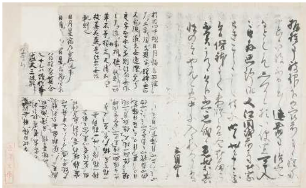
しょうめいじようじようぎやう 称名寺聖教, しょうめいじ 称名寺 (神奈川県立金沢文庫保管) かなざわぶんこもんじよ 金沢文庫文書