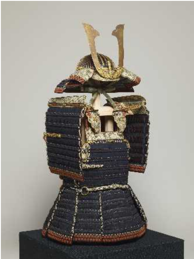
くろかわおどしどうまる 黒韋威胴丸, かぶと おおそでつき 兜, 大袖付 宗教法人春日大社 あすがたいしや