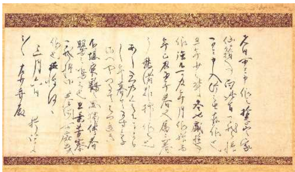
三月六日 藤原俊成自筆書状 左少弁殿宛