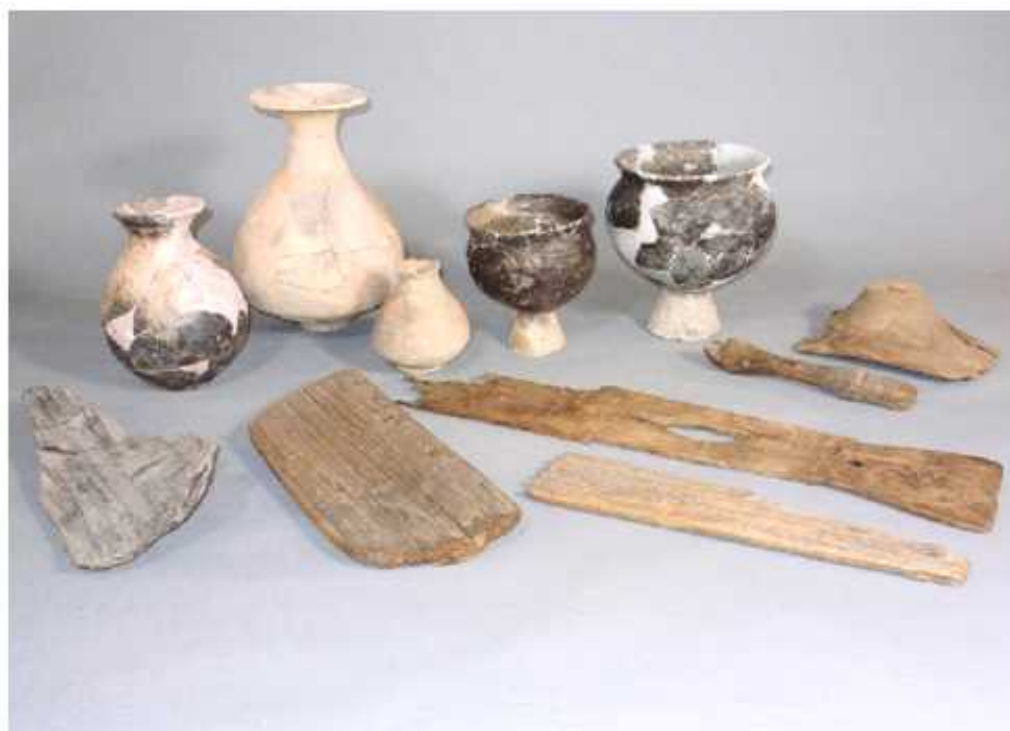
静岡県登呂遺跡出土品