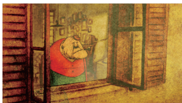
第12回 アニメーション部門 大賞

© 2000 ARMOR PROJECT/BIRD STUDIO/HEART BEAT/ARTEPIAZZA/SQUARE ENIX All Rights Reserved.