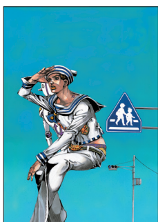
第17回 マンガ部門 大賞