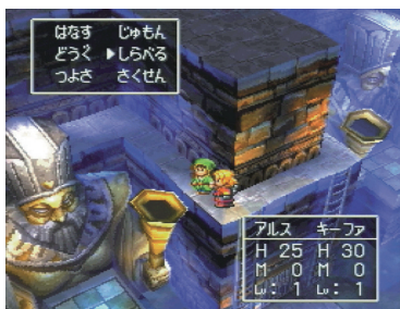
第4回 デジタルアート(インタラクティブ)部門 大賞