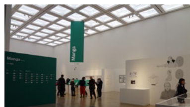
第19回受賞作品展 (国立新美術館/東京・六本木)

また、受賞作品を中心に、優れたメディア芸術作品を総合的に紹介する展覧会を国内外で開催しています。