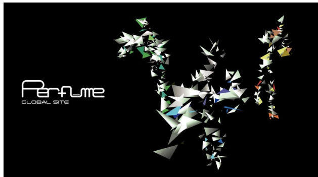
Perfume "Global Site Project"