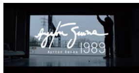
©Honda Motor Co., Ltd. and its subsidiaries and affiliates Sound of Honda / Ayrton Senna 1989

アートとエンターテインメントの境界を横断し、テクノロジーを駆使した表現で注目を集める「ライゾマティクス」のメンバーによる作品は文化庁メディア芸術祭で度々受賞しています。今年10周年を迎える彼らの作品を紹介します。