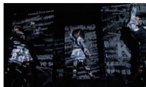
Perfume ライブ「SXSW 2015」

第16回エンターテインメント部門大賞の「Perfume "Global Site Project"」など、広島出身のテクノポップユニット「Perfume」をキーワードに、先端テクノロジーを駆使したライブやミュージックビデオ、ウェブサイトなどをまとめて紹介します。