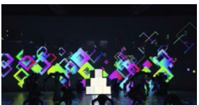
©YASKAWA x Rhizomatiks x ELEVENPLAY YASKAWA x Rhizomatiks x ELEVENPLAY