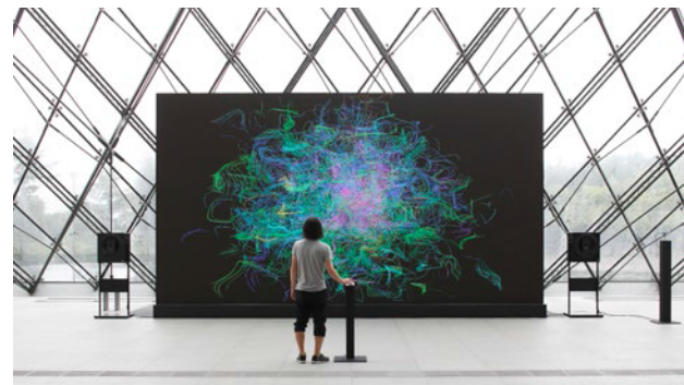
センシング・ストリームズ 一不可視、不可聴