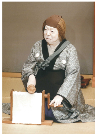
（ だてくらべ 競 いせものがたり 伊勢物語）