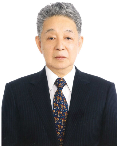
（河野均（芸名 中村東蔵）氏）