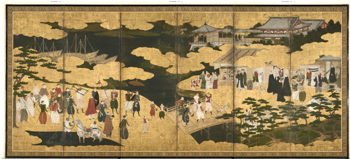
(南蛮人渡来図・右隻)