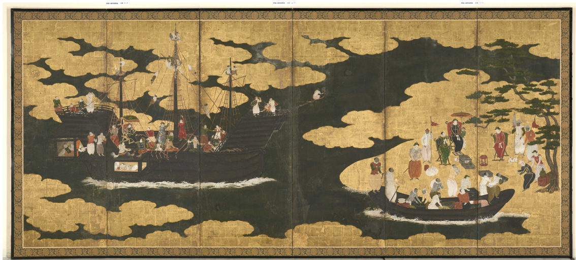
(南蛮人渡来図・左隻)