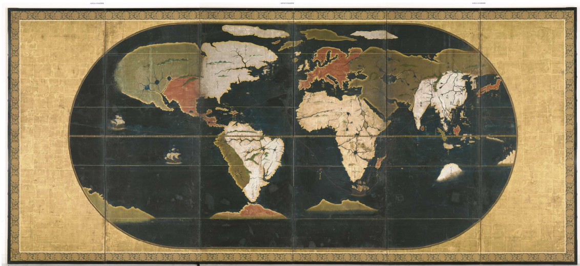
(世界及日本地図のうち世界図)