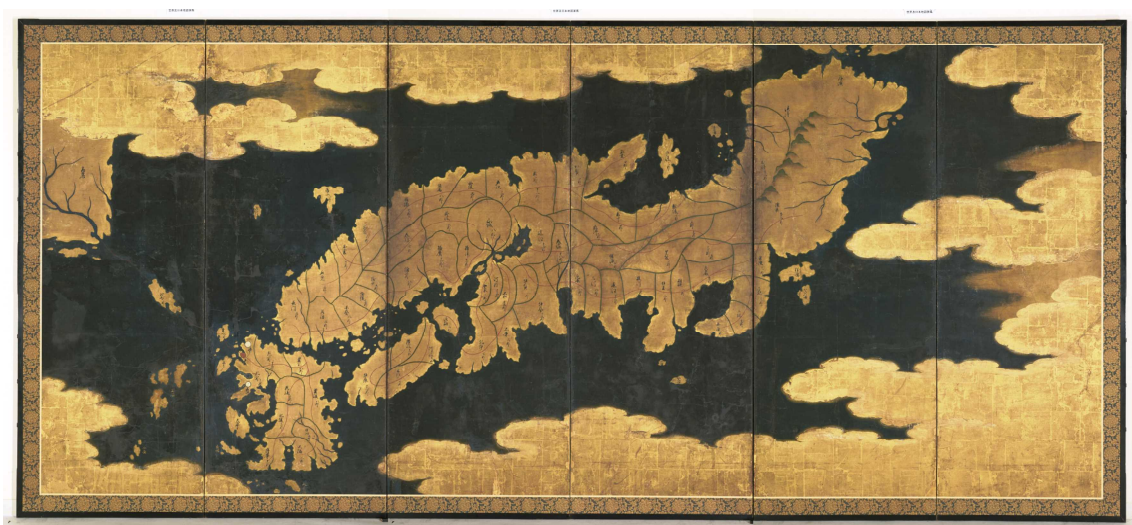
(世界及日本地図のうち日本図)