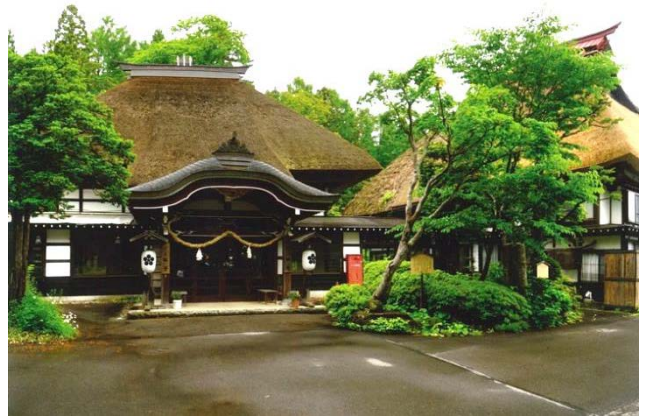
保存地区の伝統的な宿坊

戸隠高原の南向き斜面に広がる宝光社の集落