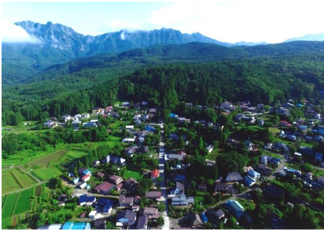
空から見た戸隠の集落

戸隠高原の南向き斜面に広がる宝光社の集落