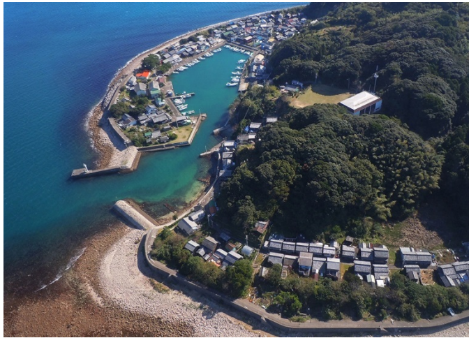
空から見た出羽島の集落