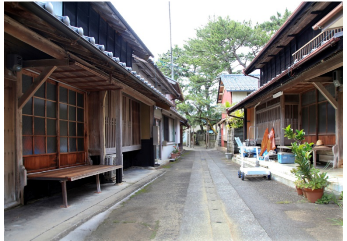
砂嘴上に形成された町並み