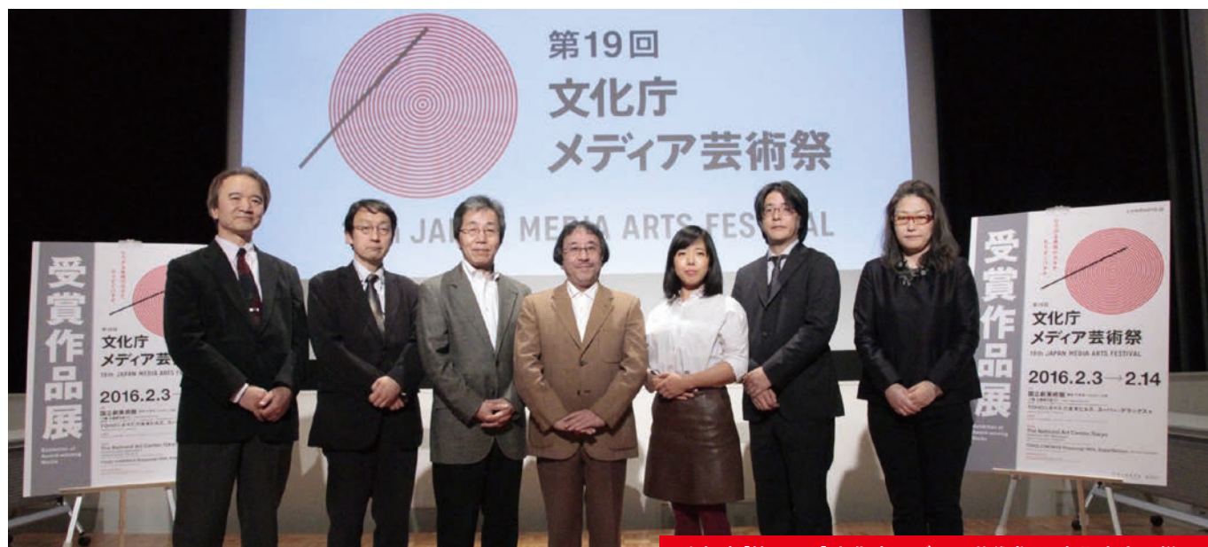
昨年度〔第19回〕文化庁メディア芸術祭 記者発表会の様子

— 受賞発表(記者発表会)は NTTインターコミュニケーション・センター〔ICC〕で開催 —