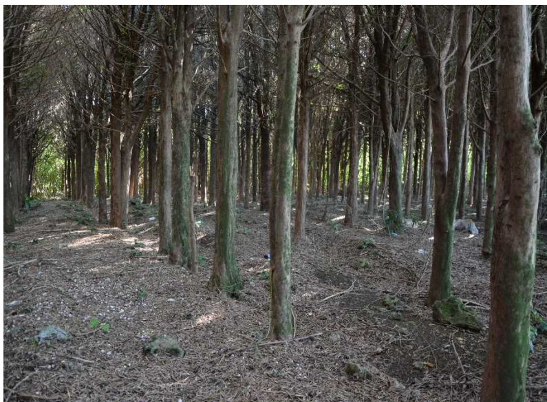
3. 野原鏡原イヌマキ林