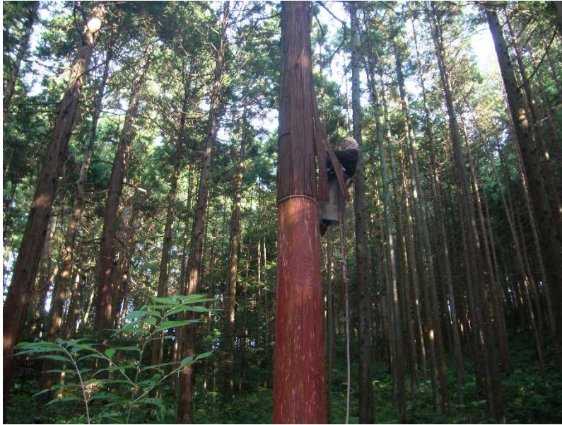
1. 志波彦神社鹽竈神社境内林