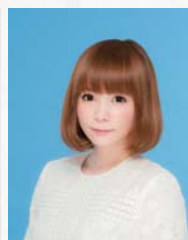
歌手・タレント・女優 中川 翔子