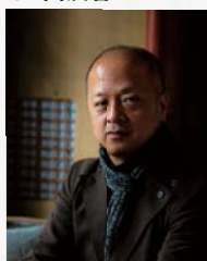
美術家 十代大樋 長左衛門 (年雄)