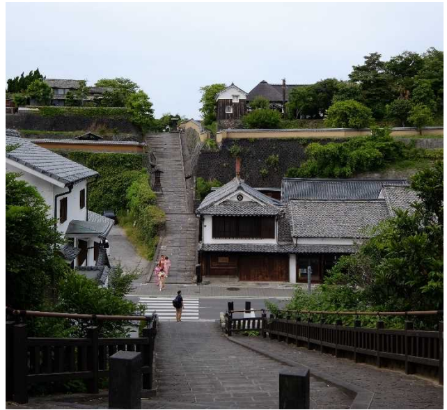
【右】北台（写真奥）と南台（写真手前）を結ぶ坂