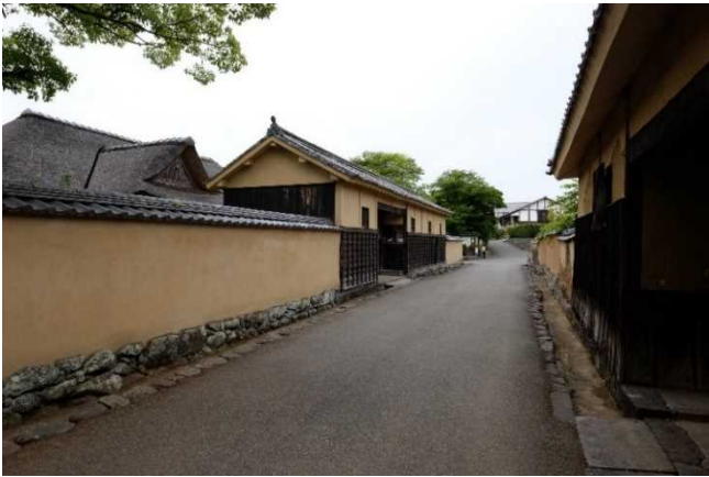
【上】江戸時代の重臣の屋敷が並ぶ北台の町並み