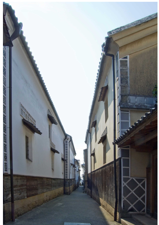
【上】旧湊浜（現在の鞆港）と旧東浜を結ぶ通り沿いの町並み