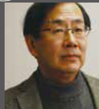
「東アジア文化都市 2017 京都」アジア回廊現代美術展 アーティスト・ディレクター 京都芸術センター館長、多摩美術大学学長