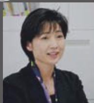
プロデューサー / 東京藝術大学大学院映像研究科教授