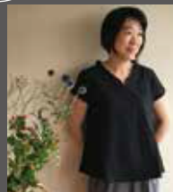
「東アジア文化都市 2017 京都」アジア回廊現代美術展 キュレーター / アシスタントディレクター 京都芸術センターチーフプログラムディレクター