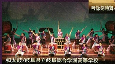
和太鼓/岐阜県立岐阜総合学園高等学校