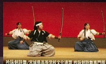
吟詠剣詩舞/宮城県高等学校文化連盟 吟詠剣詩舞専門部

京都市左京区下鴨半木町1-26 TEL.075-711-2980 京都市営地下鉄烏丸線「北山」駅下車 (1) 番、(3) 番出口を南へ徒歩3分