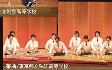
箏曲/東京都立狛江高等学校