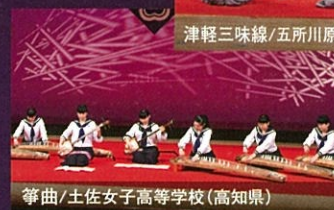
箏曲/土佐女子高等学校(高知県)