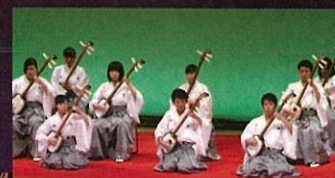
津軽三味線/五所川原第一高等学校(青森県)