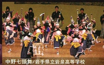
中野七頭舞/岩手県立岩泉高等学校