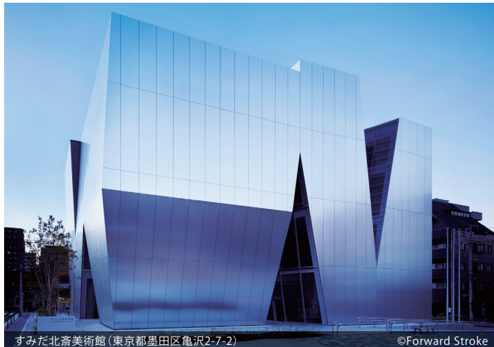
すみだ北斎美術館 (東京都墨田区亀沢2-7-2)