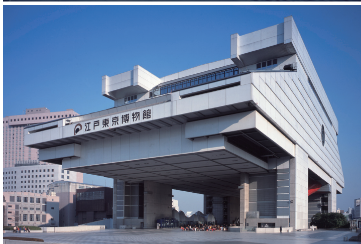
東京都江戸東京博物館 (東京都墨田区横網1-4-1)