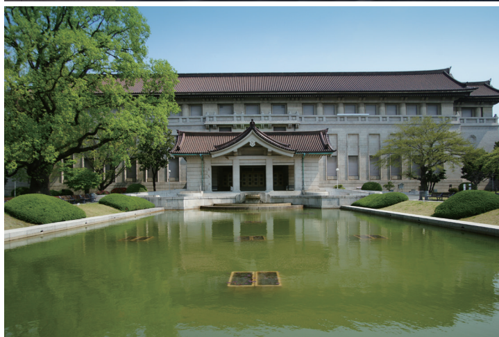
東京国立博物館 (東京都台東区上野公園13-9)