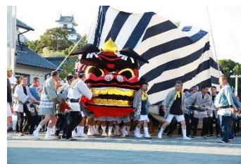
【掛川祭における三大余興の1つ「大獅子」】

国指定重要文化財「掛川城御殿」や国指定史跡「横須賀城跡」及びこれらの城下町等と、掛川祭における三大余興や三熊野神社大祭等からなる歴史的風致の維持向上を図るため、伝統的建造物の保存修理・活用、道路の無電柱化や舗装の美装化、城跡の復元等が位置づけられています。