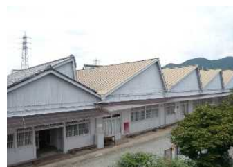
【織物産業を営むノギリ屋根工場】

重要伝統的建造物群保存地区「桐生市桐生新町伝統的建造物保存地区」及びその周辺地域と、伝統産業としての織物産業やこれに由来する機神信仰 はたがみしんこう きりゅうぎおんまつり 、桐生祇園祭等の伝統的な祭礼や行事等からなる歴史的風致の維持向上を図るため、伝統的建造物の保存修理や公開活用、道路の無電柱化や舗装の美装化、織物産業の保護育成事業等が位置づけられています。