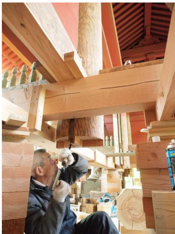
古式の木工技術による修理の様子

我が国の建造物は近年まで木造がその主流であり，したがって建築技術は木工技術によって代表され，それは世界に類例稀 まれ なほど精巧な成果を示すものである。しかし，近年では，材料，工具等の変化や，いわゆる近代建築の隆盛に伴って，古式の木工技術を体得する者は少なく，しだいに技術水準が低下しつつある。特に文化財建造物の保存修理に当たっては，各時代の木工技術の正確な踏襲，再現が求められるところから，現在数少ない木工技能者が体得している古式の木工技術を伝承し，錬磨してその水準を確保する必要がある。