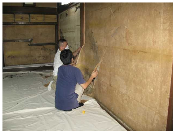
障壁画取り外し作業

我が国伝来の書画類は四季の温湿度変化の影響を受けやすい紙や絹を主材料とするものが多いため、原状のままに伝来するものは稀で、いずれも本紙を紙、糊 のり によって補強した卷子 むんす 、掛幅 かけふく 、屏風 びょうぶ 、折帖 おりちょう などの様々な表具の形態に仕立てられて伝わっている。換言すれば、これら文化財は紙、糊による裏打 うちかえ によってのみ本体の保存が図られているといっても過言ではない。それゆえ、こうした脆弱 ぜいじやく な文化財を後世に維持、保存していくためには、50年から100年を周期として、本紙を支える裏打紙の打替が必要となっている。これらの修理は、表具の解体、解装 かいそう から旧裏打紙の除去、繕い、裏打替から表具仕立てへの工程を要するもので、各形態の文化財が容易に解体され、新たな生命によって甦 よみがえ ることが常に可能な状態にあるべきことが要求されるのである。この修理に当たっては、当然のこととして伝統的な技術に裏付けられた卓越した装潢の技が必要不可欠となっている。