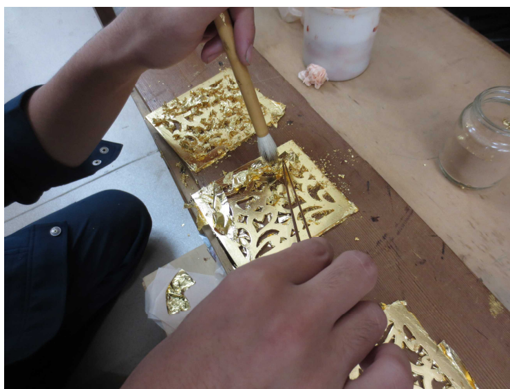
鏝金具技術研修の様子

また建造物の保存修理を適切な周期で行うためには、これらの技術の円滑な継承が必要となるが、一般建築における需要が少ないために、継続的かつ効果的な技術伝承が困難となっている。