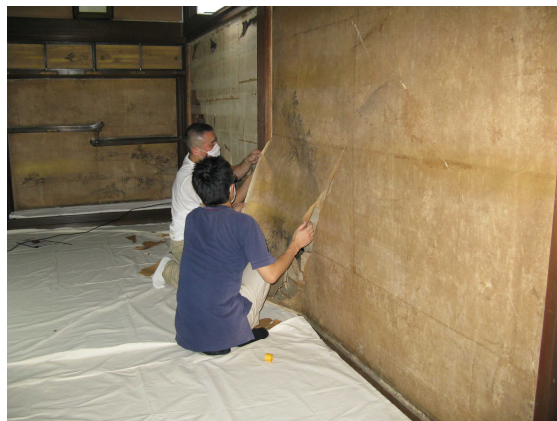
障壁画取り外し作業

我が国伝来の書画類は四季の温湿度変化の影響を受けやすい紙や絹を主材料とするものが多いため、原状のままに伝来するものは稀で、いずれも本紙を紙、糊 のり によって補強した卷子 むんす 、掛幅 かけふく 、屏風 びょうぶ 、折帖 おりちょう などの様々な表具の形態に仕立てられて伝わっている。換言すれば、これら文化財は紙、糊による裏打 うちかえ によってのみ本体の保存が図られているといっても過言ではない。それゆえ、こうした脆弱 ぜいじやく な文化財を後世に維持、保存していくためには、50年から100年を周期として、本紙を支える裏打紙の打替が必要となっている。これらの修理は、表具の解体、解装 かいそう から旧裏打紙の除去、繕い、裏打替から表具仕立てへの工程を要するもので、各形態の文化財が容易に解体され、新たな生命によって甦 よみがえ ることが常に可能な状態にあるべきことが要求されるのである。この修理に当たっては、当然のこととして伝統的な技術に裏付けられた卓越した装潢の技が必要不可欠となっている。