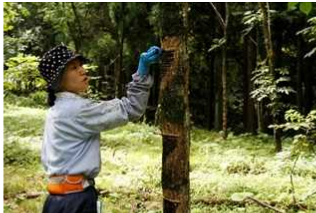
漆掻き研修の様子

日本産漆は透明度，接着力，堅牢度等に優れており，漆芸の制作や漆工品等の保存修理に不可欠の原材料である。漆生産に関する技術には，漆樹の植栽及びその保育・管理，成長した原木からの漆液の採取（漆掻き）等がある。なかでも，掻き鎌や掻き篋などを用いて，樹幹につけた傷から滲み出る生漆を採取する技術（漆掻き技術）は重要なものであり，漆樹を傷めず良質な漆を多く採取するには高度な技量が要求され，長年の経験を積んだ専門の技術者（漆掻き職人）によって行われているが，近年，技術者の減少及び高齢化が急速に進んでいる。