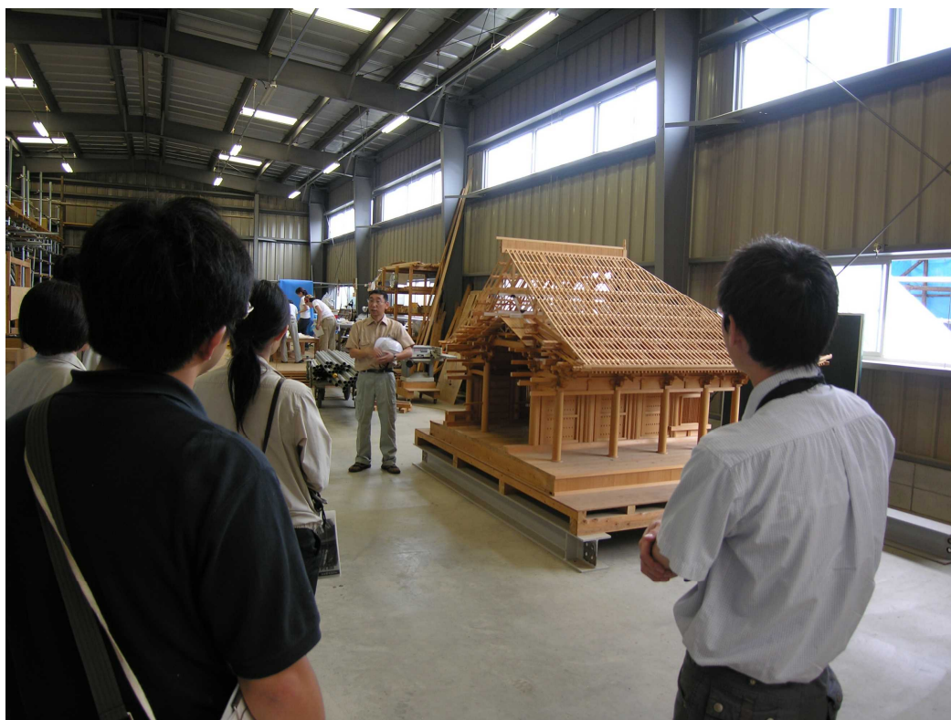
建造物修理中堅研修の様子

我が国における文化財建造物の保存修理は120年以上の伝統をもち、現在まで約2,200棟の建造物が根本修理を受けている。これらの建造物は7世紀から20世紀初頭まで約1300年にわたる各時代の遺構で、その種別は社寺、城郭、住宅、墓碑、橋梁 きょうりょう 等あらゆる分野にわたっており、構造も木造、石造、煉瓦造 れんがぞう 等多岐にわたり、また地域差や工匠の系統による差異もある。したがってその保存修理に当たる技術者には高度な専門知識に基づく技術が要求され、この修理技術は文化財建造物の保存には不可欠のものである。