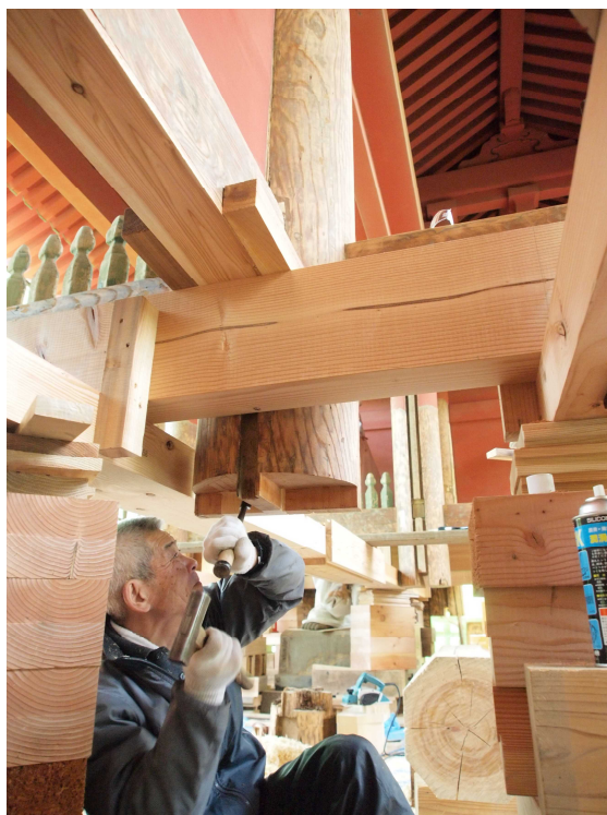
古式の木工技術による修理の様子

我が国の建造物は近年まで木造がその主流であり，したがって建築技術は木工技術によって代表され，それは世界に類例稀 まれ なほど精巧な成果を示すものである。しかし，近年では，材料，工具等の変化や，いわゆる近代建築の隆盛に伴って，古式の木工技術を体得する者は少なく，しだいに技術水準が低下しつつある。特に文化財建造物の保存修理に当たっては，各時代の木工技術の正確な踏襲，再現が求められるところから，現在数少ない木工技能者が体得している古式の木工技術を伝承し，錬磨してその水準を確保する必要がある。