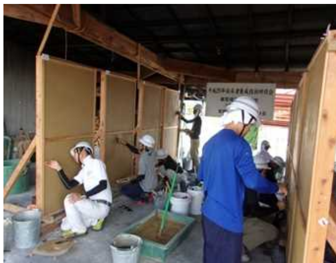
壁研修の様子（大津壁実技）

良質の日本壁を製作するためには、各種素材の吟味から施工まで高度な熟練が必要であり、文化財建造物修理においては、製作された壁の強度や美観が修理工事の良否に大きく影響する。しかし、日本壁製作のような湿式工法には十分な工期と熟練が必要であるため、近年の一般建築においては乾式工法が主流となっている。また湿式工法についても、モルタル下地の上に合成樹脂系資材で仕上げる工法などが一般化していることから、良質な日本壁を製作できる技術者が激減している。