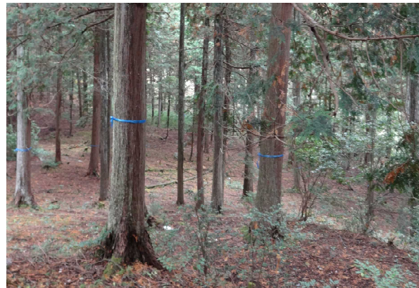
4. 京都市合併記念の森ヒノキ林