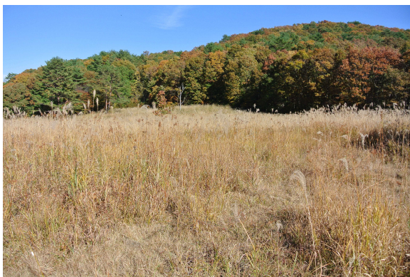
5. 広陵学園芸北文化ランド茅場