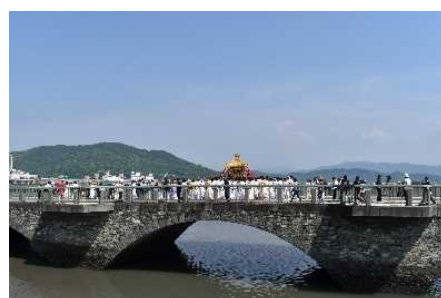
【紀州東照宮例大祭（和歌祭）】

国指定名勝「和歌の浦 わかうら 」や、国指定重要文化財紀三井寺 きみいでら 「護国院多宝塔 ごこくいんたほうとう 」及びその周辺地域と、紀州東照宮 きしゅうどうしょうぐうれい 例大祭や紀三井寺境内の湧水の保全活動、和歌浦湾の漁業 たいさい と結びついた のぼり 幟 のぼり 揚げ神事等の伝統行事等からなる歴史的風致の維持向上を図るため、紀州東照宮等の歴史的建造物の保存修理や公開活用、紀三井寺周辺等の修景整備、和歌祭等の祭礼活動に係る活動支援や担い手育成に関する事業等が位置づけられています。