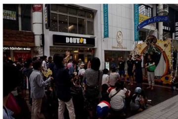
上通チャリティ演劇まつり