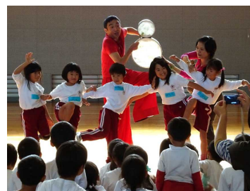
学校で行われているココロ とカラダワークショップ

小中学校において、演劇、ダンス、音楽など多様な分野の専門家によるワークショップを実施し、他者との共生について考え、コミュニケーション能力の育成を図るなど、文化芸術の持つ力を教育に活かす取組を進めている。また、演劇という視点からコミュニケーションを捉え、教育現場で実践できるよう、教員を対象として、演劇の手法を取り入れたワークショップ形式の学びの機会を設けている。