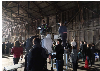
THE OUTSIDER (ハイクット 映画)