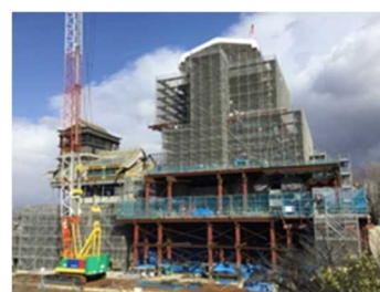
復旧工事中の大小天守