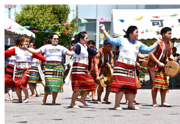
多文化共生センター （フレビア）で開催された フィリピンフェスティバル

また、様々な国籍の市民が文化・慣習の違いを超えて舞台作品を作るプロジェクトも継続して実施しており、お互いの個性や価値観の違いを認め合う多文化共生のメッセージを市民に伝える場となっている。