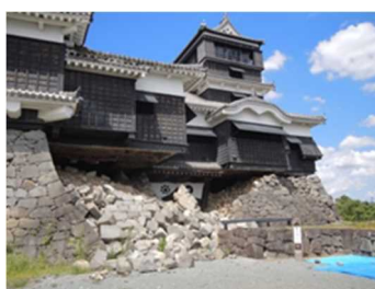
天守閣入り口(被災後)