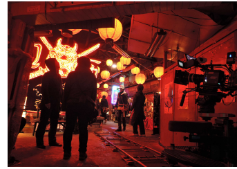
HIGH&LOW THE MOVIE2/END OF SKY