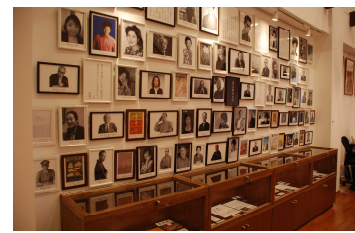
北九州文学サロン