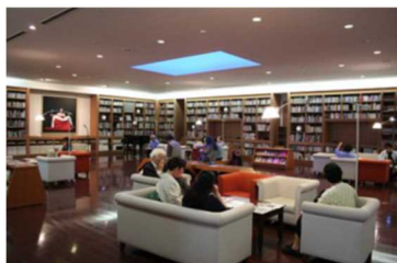
ホームギャラリー

芸術文化の鑑賞のみならず活動の場を提供し、『文化芸術の力による心の復興』に取り組んだ。