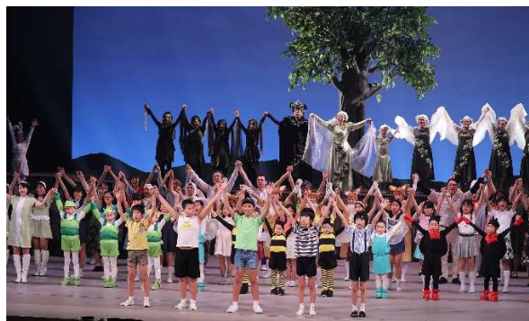
市民ミュージカル「君といた夏」 ～スタンドバイミー可児～