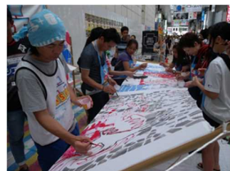
熊本復興マッチフラッグWS