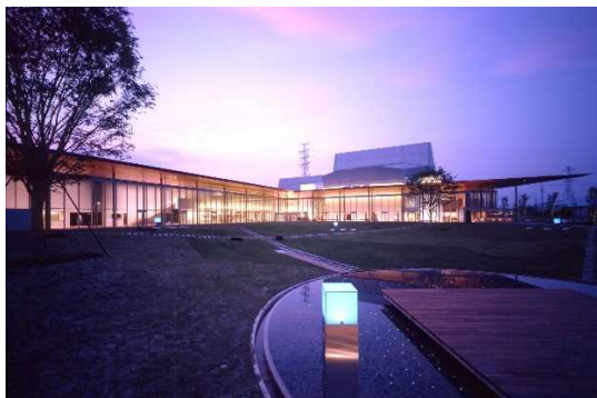
可児市文化創造センター外観