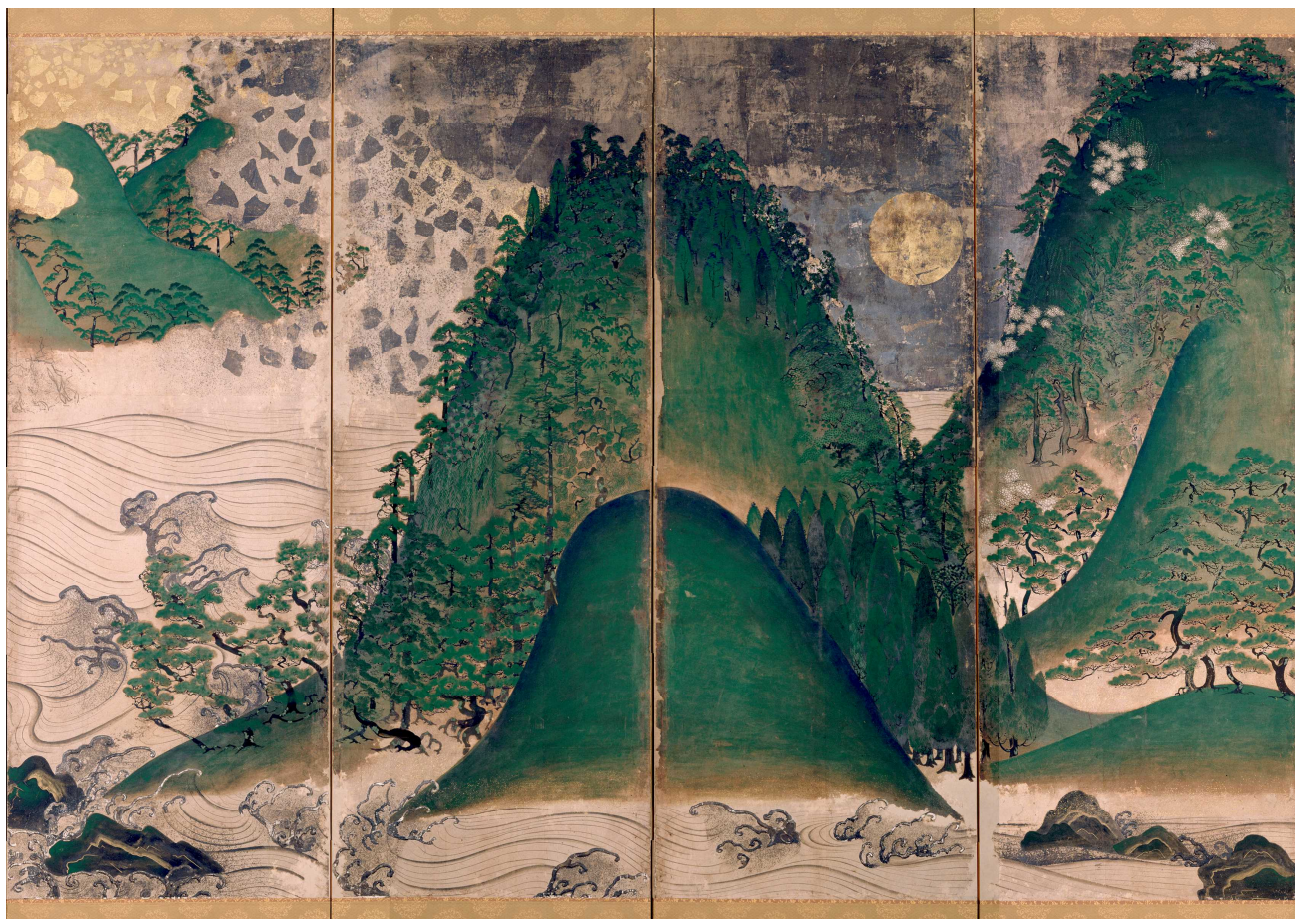
紙本著色日月四季山水図（右隻部分） （宗教法人天野山金剛寺所蔵）

この度、新たに国宝・重要文化財として指定されることになった美術工芸品を、別紙のとおり平成30年4月17日（火）より東京国立博物館で公開しますので、お知らせします。