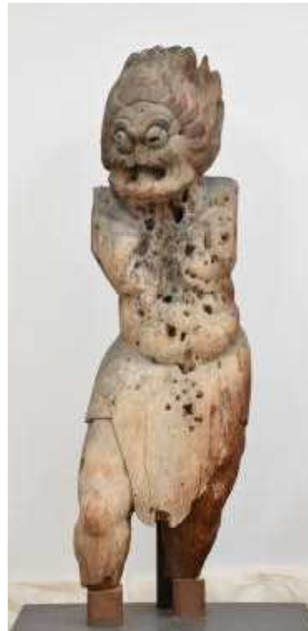
（写真（左）：西夜叉／写真（右）：東夜叉） 東夜叉神のみ展示