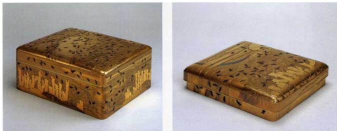
宇治川蛍蒔絵料紙箱・硯箱【宮内庁三の丸尚蔵館蔵】