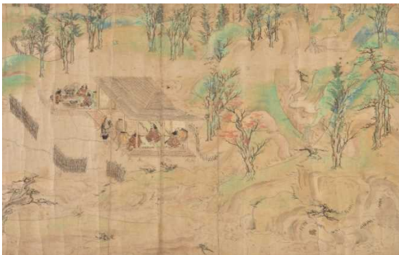
紙本著色西行物語絵詞【重文】