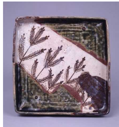
織部松文四方平皿