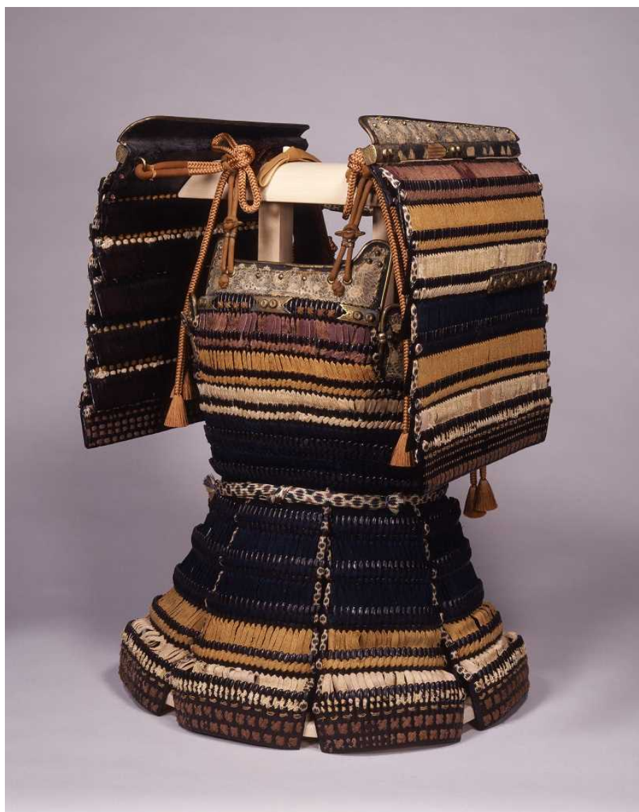
重要文化財 色々威腹巻 大袖付 文化庁蔵

文化庁及び徳島市立徳島城博物館は、国民に文化財の鑑賞の機会を提供するため、文化庁が近年購入した文化財を展覧する「新たな国民のたから－文化庁購入文化財展－」を開催しますので、お知らせします。