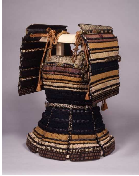
色々威腹巻 大袖付【重文】