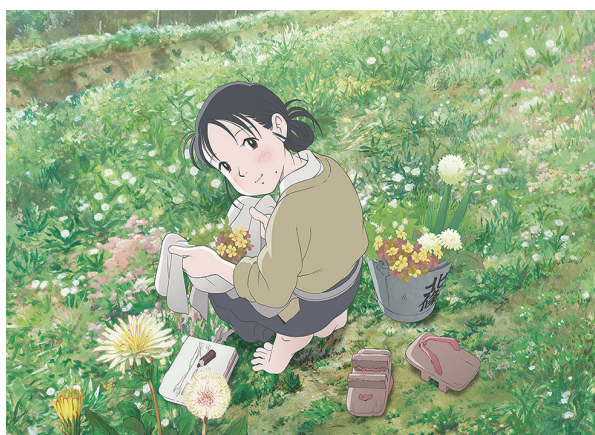
© Fumiyo Kouno/Futabasha/Konosekai no katasumini Project