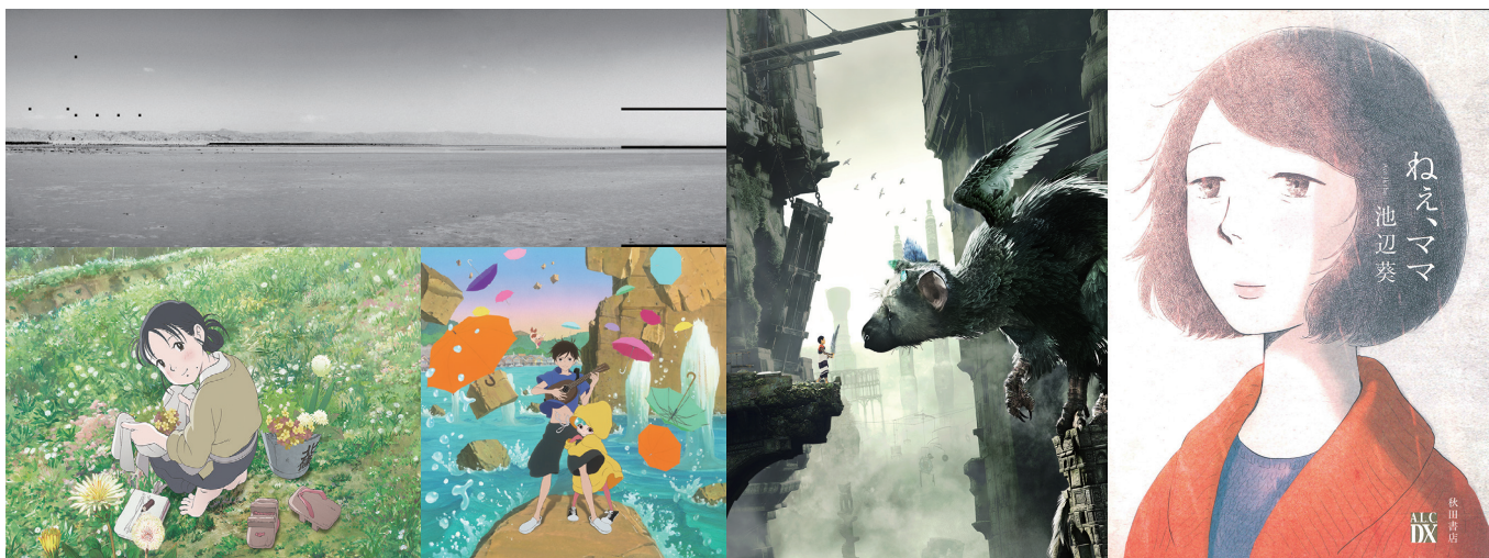
(上) © Haythem Zakaria (下左) © Fumiyo Kouno/Futabasha/Konosekai no katasumini Project (下右) © 2017 Lu Film partners

本展では、アート、エンターテインメント、アニメーション、マンガの4部門に応募された4,192作品(過去最高世界98の国と地域からの応募)の中から厳正な審査を経て選ばれた全受賞作品と、功労賞受賞者の功績等を紹介します。優れたメディア芸術作品の数々と、国内外の多彩なクリエイターやアーティストが集う様々な関連イベントを通じて、メディア芸術の“時代(いま)”を映し出します。