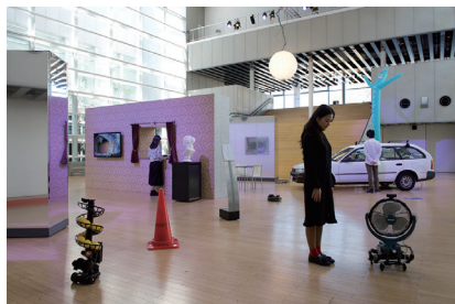
Commissioned by Yamaguchi Center for Arts and Media [YCAM] 2017 Co-developed with YCAM InterLab in collaboration with Yushin Suzuki and Takanobu Inafuku

●大賞受賞者トーク 日時：6月13日（水）16：00-17：00 ●会場：国立新美術館 3階 研修室A・B