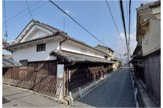
【写真2】追加選定区域の町並み