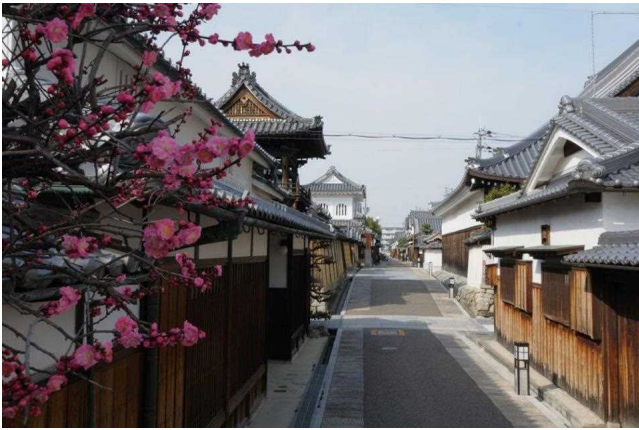
【写真1】既選定保存地区の町並み