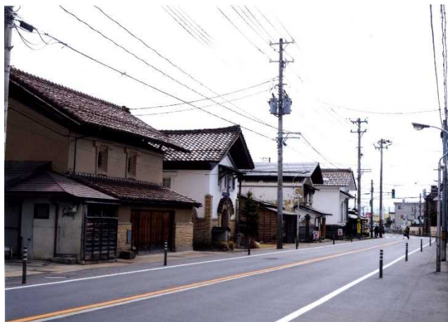
【写真1】店蔵が並ぶ町並み