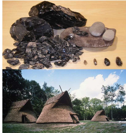
【黒曜石と「縄文ムラ」尖石遺跡】

麓のムラで作られたヒトや森に生きる動物を描いた土器やヴィーナス土偶を見ると，縄文人の高い芸術性に驚かされ，黒曜石や山の幸に恵まれて繁栄した縄文人を身近に感じることができる。