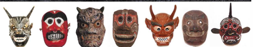
【鬼が棲む奇岩霊窟「鬼城」と表情豊かな鬼の面】