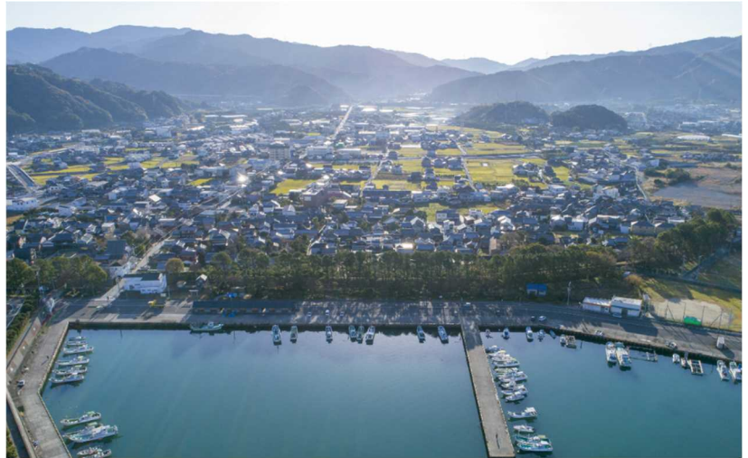
【広村堤防が築かれた広川町の海岸】

江戸時代、津波に襲われた人々は、復興を果たし、この町に日本の防災文化の縮図を浮び上らせました。防災遺産は、世代から世代へと災害の記憶を伝え、今も暮らしの中に息づいています。