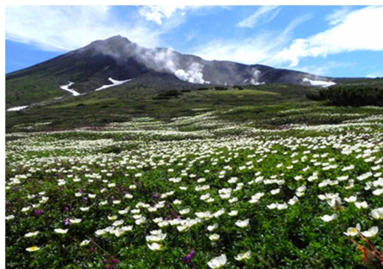
【大雪山の雄大な自然】