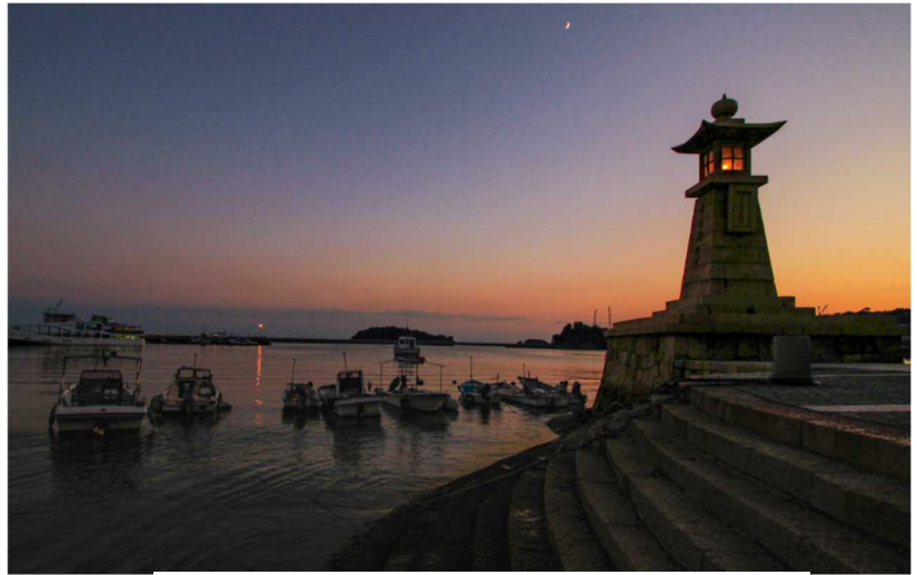
【灯りのともる常夜燈と雁木】

瀬戸内の多島美に囲まれた鞆の浦は、これら江戸期の港湾施設がまとまって現存する国内唯一の港町。潮待ちの港として繁栄を極めた頃の豪商の屋敷や小さな町家がひしめく町並みと人々の暮らしの中に、近世港町の伝統文化が息づいている。