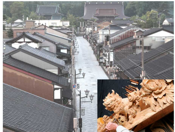
【受け継がれる木彫刻の技】

瑞泉寺 ずいせんじ の再建に端を発し、宮大工の鑿 のみ 一丁から生まれた華麗にして豪壮な井波彫刻と、その木彫刻職人たちが造りあげたまち井波。彫刻工房と町家が軒を連ねる石畳の通りには、木槌の音が響き、木々の薫りが漂う。通りには至るところに七福神や十二支などの木彫刻が飾られ、まちはさながらに木彫刻の美術館である。春には井波彫刻で飾られた曳山や屋台、獅子舞がまちを練り歩き、地域の安泰や五穀豊穡を祈る。地域の暮らしに根づく井波彫刻は、その高い技術力や芸術性を広く全国から認められ、今や日本の木彫刻文化の護り手となっている。