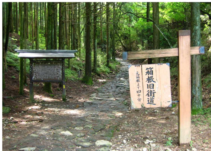
【箱根旧街道の石畳道】

さいごくだいみょう 西国大名や しょうかんちやう オランダ商館長， ちやうせんつうしんし 朝鮮通信使や ながさきぎやう 長崎奉行など，歴史に名を残す旅人たちの足跡残る街道をひととき辿れば，宿場町や茶屋，関所や並木，一里塚と，道沿いに次々と往時のままの情景が立ち現われてきて，遥 と か時代を超え，訪れる者を江戸の旅へと誘 いざな います。