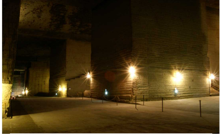
【地下迷宮「カネイリヤマ採石場跡地」】

大谷石の産地・宇都宮では、石を「ほる」文化、掘り出された石を変幻自在に使いこなす文化が連綿と受け継がれ、この地を訪れる人々を魅了する。