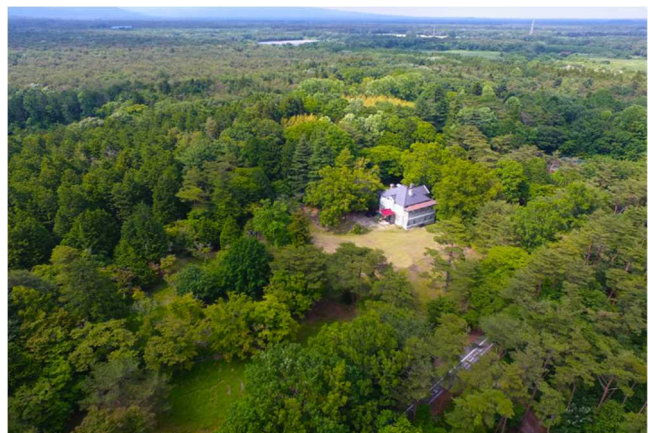
【那須野が原の大パノラマの中に佇む松方別邸】

ここは、知られざる近代化遺産の宝庫。那須野が原に今も残る華族農場の別荘を訪ねると、近代日本黎明期の熱気と、それを牽引した明治貴族たちの足跡を垣間見ることができます。