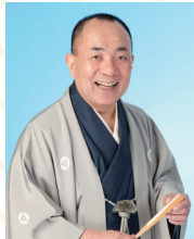
会長代行 三遊亭小遊三