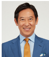
スポーツ庁長官 鈴木 大地