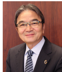
文化庁長官 宮田 亮平