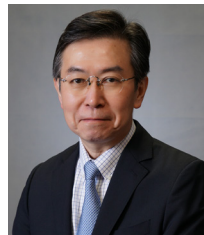
観光庁長官 田端 浩