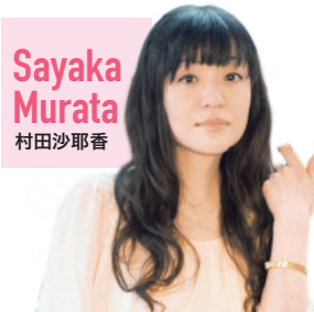
Sayaka Murata 村田沙耶香