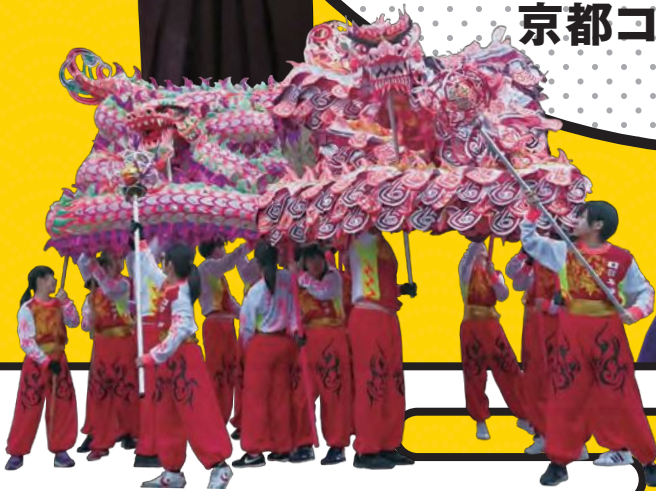
「獅子舞・龍舞」 神戸市立神港橋高等学校