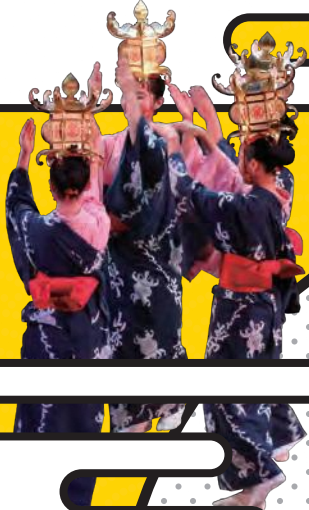
「肥後民謡」 熊本県立鹿本農業高等学校