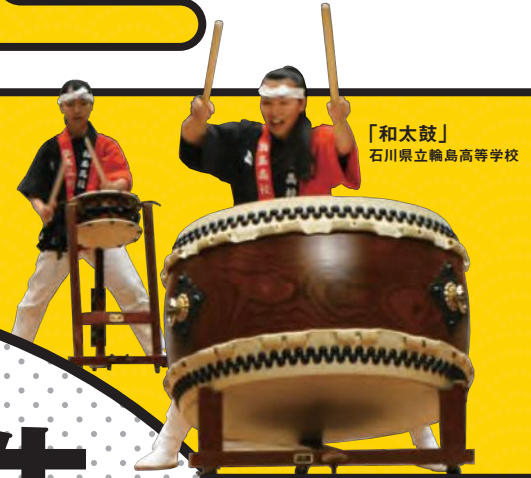
「和太鼓」 石川県立輪島高等学校