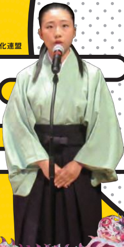
「吟詠剣詩舞」 佐賀県高等学校文化連盟