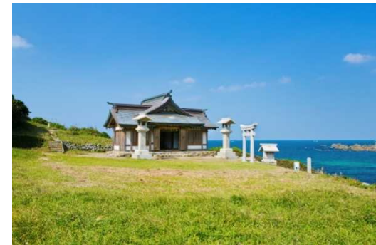
宗像大社沖津宮遙拝所