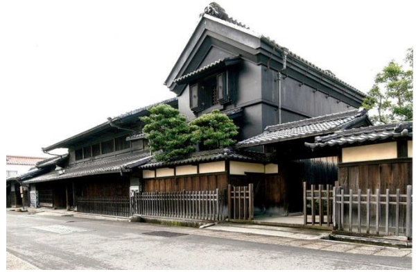
絞商の広大な屋敷構え