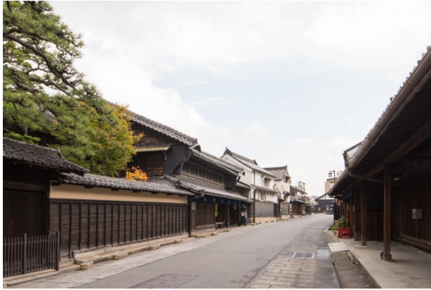
東海道沿いの町並み