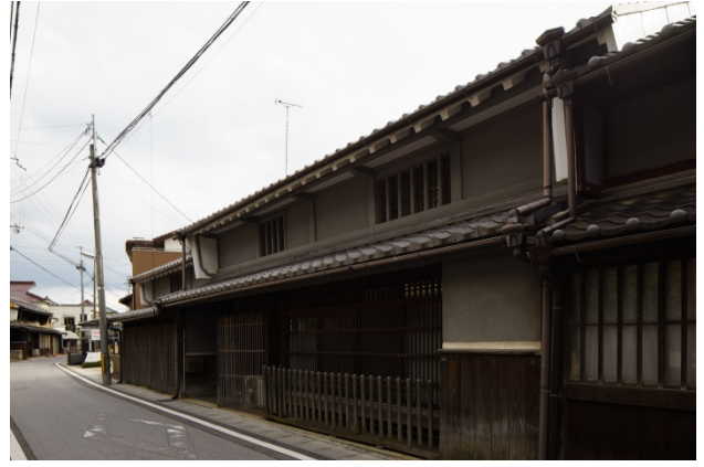
保存地区の伝統的な町家 虫籠窓や袖うだつを持つ古い形式の町家