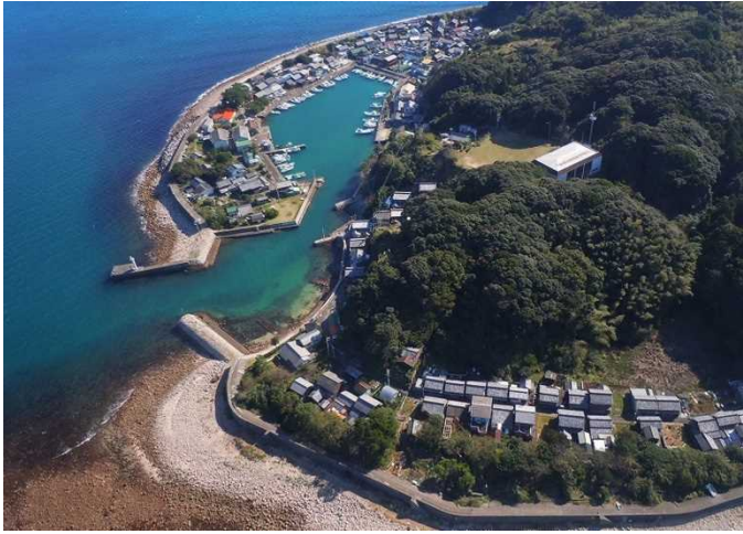
空から見た出羽島の集落