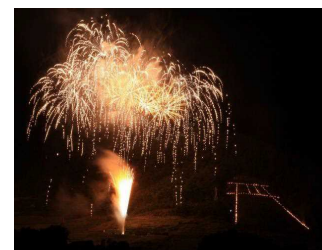
【ぶどうまつりでの鳥居焼き】

国宝「大善寺本堂」や重要伝統的建造物群保存地区等と、 武田信玄の菩提寺・恵林寺のしんげんさんや甲州街道勝沼宿 におけるぶどうまつり等からなる歴史的風致の維持向上を図 るため、伝統的建造物群保存地区環境整備や農業基盤整備促 進、歴史文化の発信事業等が位置づけられています。