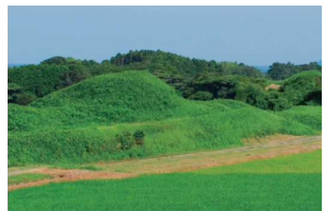
新原・奴山古墳群