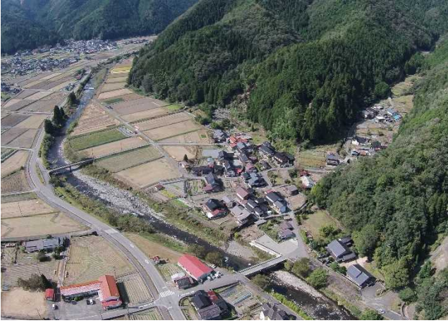
保存地区鳥瞰写真