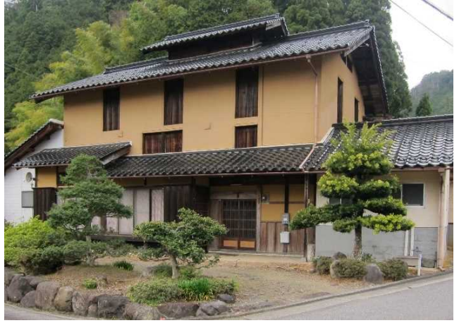
保存地区を特徴づける三階建の農家主屋