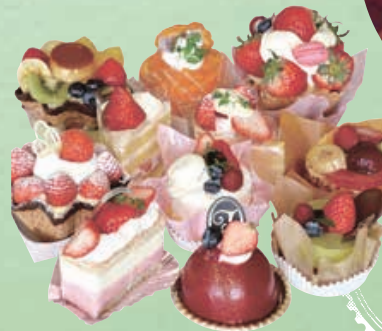
地元 精華町の 絶品 スイーツも!