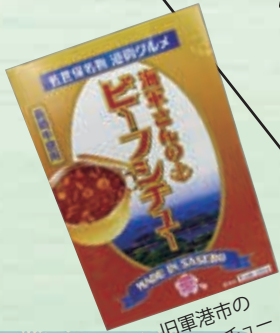
旧軍港市の ビーフソース