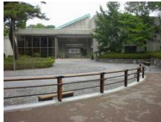
奈良県立民俗博物館(大和郡山市)