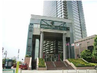
東京都写真美術館(恵比寿)