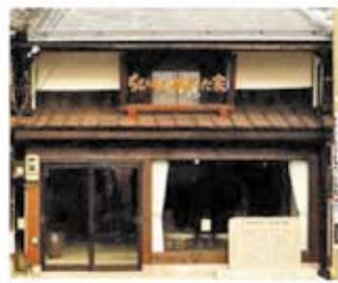
第二会場 ちひろの生まれた家記念館