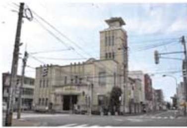
第一会場 武生公会堂記念館