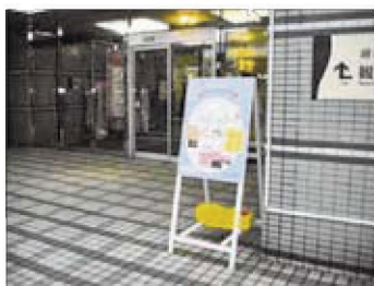
JR武生駅前設置の企画展全体案内図