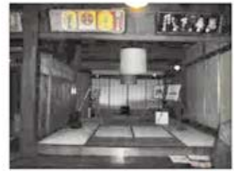
第三会場 府中町屋倶楽部