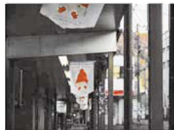
商店街に設置したペナント