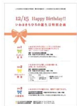
誕生日企画チラシ