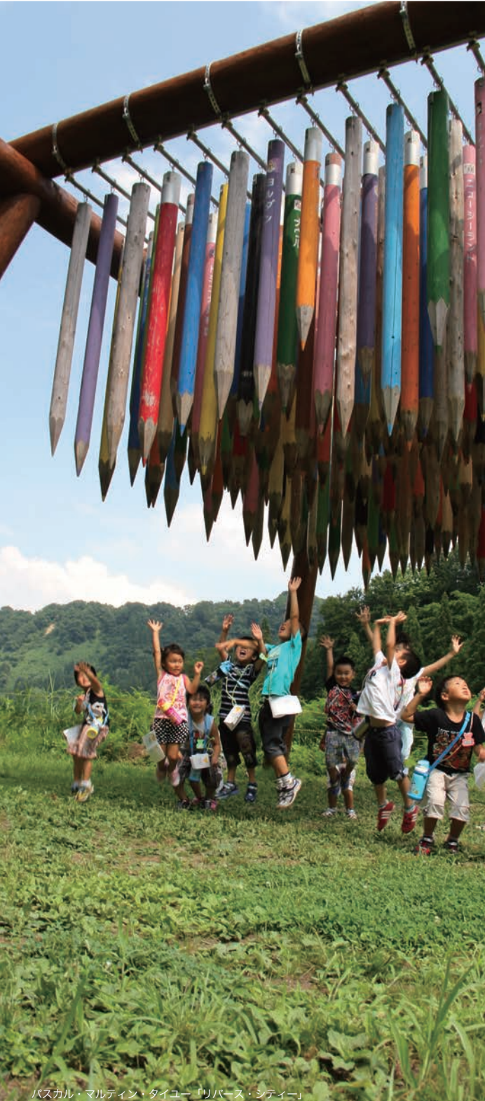
バスカル・マルティン・タイユール「リバース・シティ」