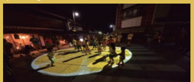
2015 アニメーションマッピング

まにわ映像フェスティバル 2016 会期 8月11日(木)~23日(火) 会場 勝山文化往来館「ひしお」 URL http://hishioarts.com/exhibition-events/upcomingexhibitions/art-fes-2016/