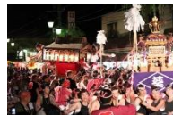
温泉夏祭の華神輿

長野県内屈指の規模を誇る温泉街、温泉夏祭や河川敷での納涼煙火大会、室町時代再建の智識寺大御堂や太々御神楽など地域で守り伝えてきた歴史的風致です。