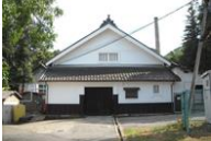
江戸時代から続く酒蔵

江戸時代に建てられた酒蔵や米蔵、桑原宿の面影を残すだつや格子戸の歴史的建造物とともに、酒造りや中原の獅子舞などの伝統が息づく歴史的風致です。