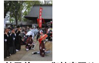
社殿前での御神事踊り

御神事踊りは、雨宮地区の人びとによって、約四百年にわたって引き継がれてきた民俗芸能の歴史的風致です。