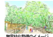
無電柱化整備のイメージ

岐阜公園内及び隣接する市道において、電線共同溝敷設による無電柱化整備を行い、景観に配慮した道路修景整備を行う。